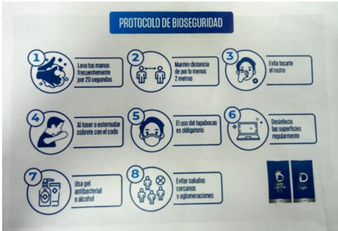
Imagen 6. Protocolo de Bioseguridad