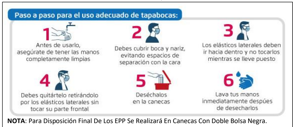
Imagen 1. Instructivo uso adecuado de tapabocas