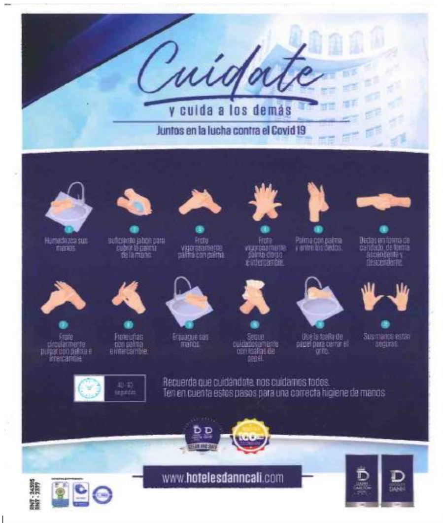
Imagen 2. Instructivo Lavado de Manos

g. Antes de tocarse la cara, tocar o acariciar sus animales de compañía, recoger sus excretas, o realizar el manejo de sus alimentos.