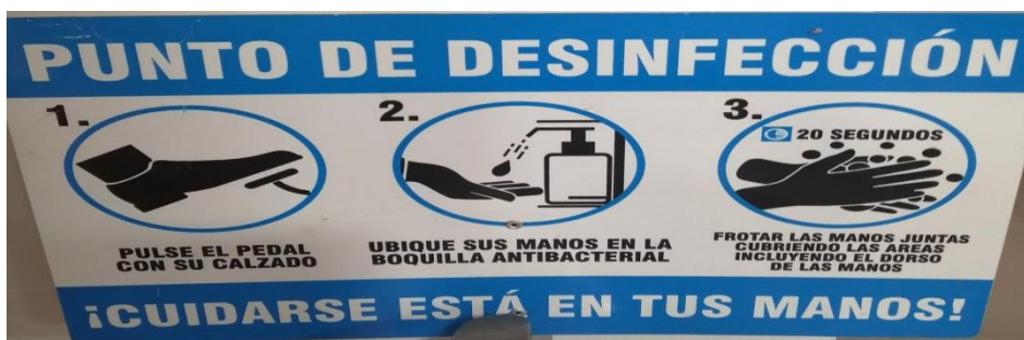
Imagen 3. Instructivo desinfección de manos con Gel Glicerinado